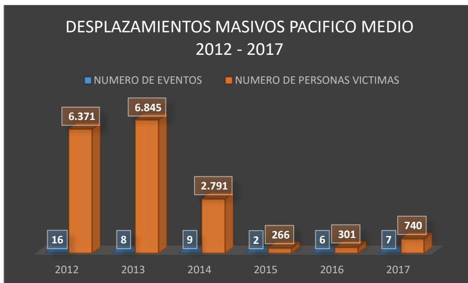
Ilustración del equipo Acción Humanitaria, datos enero-junio de 2017.