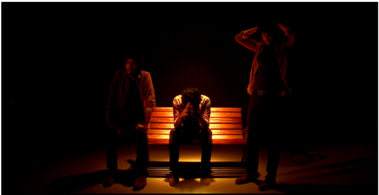
Imagen 1. Carta a Cali. Video Arte. 2018

ellas. En la mayoría de los casos los procesos de transición de estas personas se ven obstaculizados principalmente por el miedo que les genera la presión social, la discriminación, el aislamiento o la alienación. Es así como surge el proyecto presente a través de esta temática y las dificultades que presentan los sujetos en transición de género. A continuación, en la imagen 1 se puede apreciar una fotografía de este proyecto.