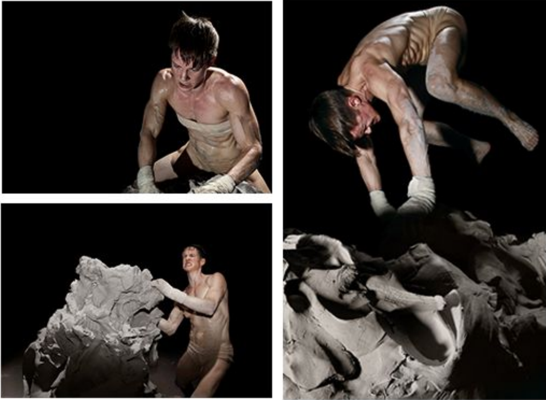
Imágenes 5, 6 y 7 Becoming an Image . Heather Cassils. (2012).

Otro artista que reviso en este proceso fue Diego Maeso debido a que existen artistas que manifiestan su necesidad de expresión a través de otras formas materiales como la fotografía, donde pretenden dimensionar el estado de su cuerpe mediante la estética mencionando los cuestionamientos que surgen gracias a la construcción de esta. Es así como hay dos obras de este artista que resultaron importantes en este proceso. La primera titulada Gender Fluid , en la que Maeso pretende enfocar su discurso en la incomodidad que le resulta