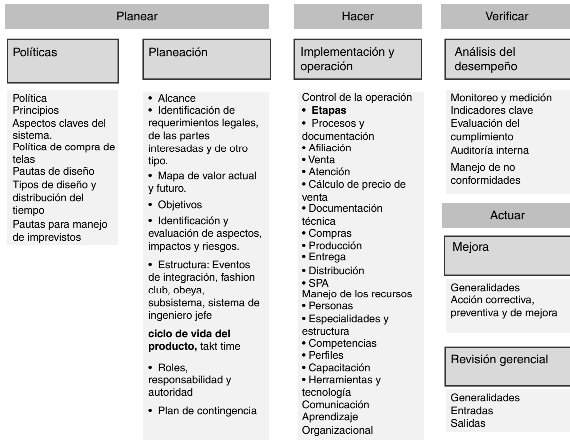
Figura 2. Configuración final del sistema de desarrollo de blusas de Equilibra.

rados en estos y transfiriendo conocimiento a la academia por medio de capacitaciones y asesorías a estudiantes.