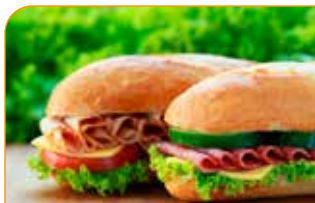
Sandwich con pan frances