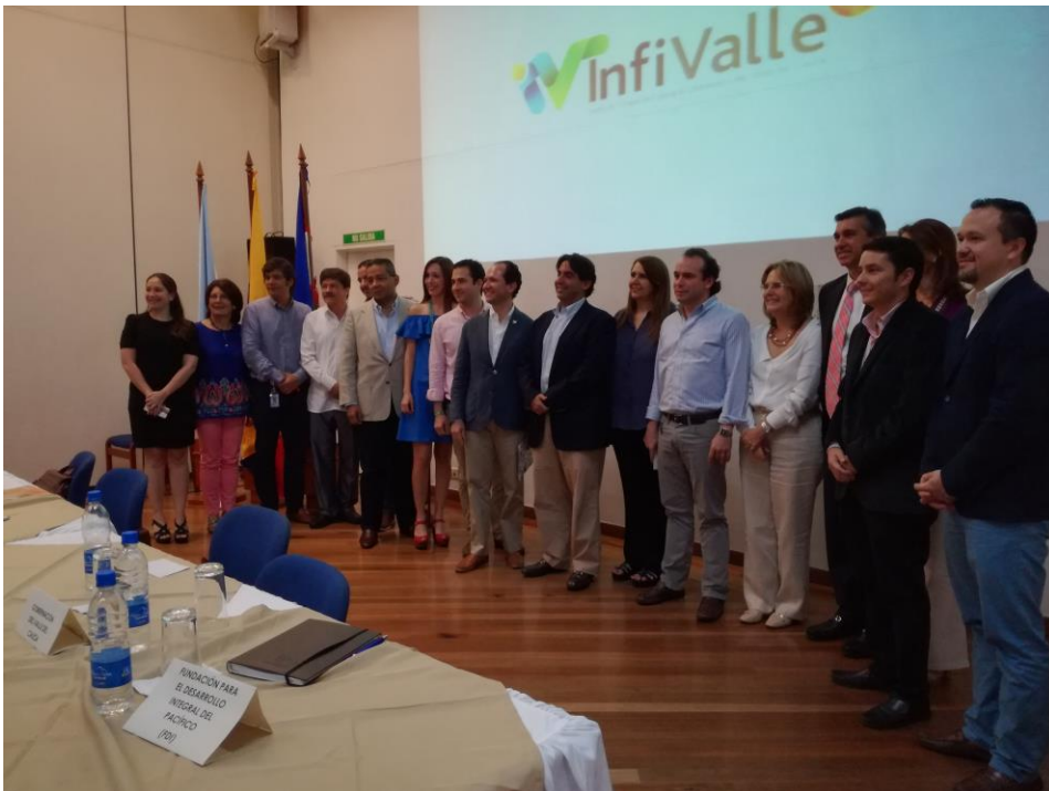
Firma del Acuerdo de Voluntades de la Red de Cooperación Internacional del Valle del Cauca