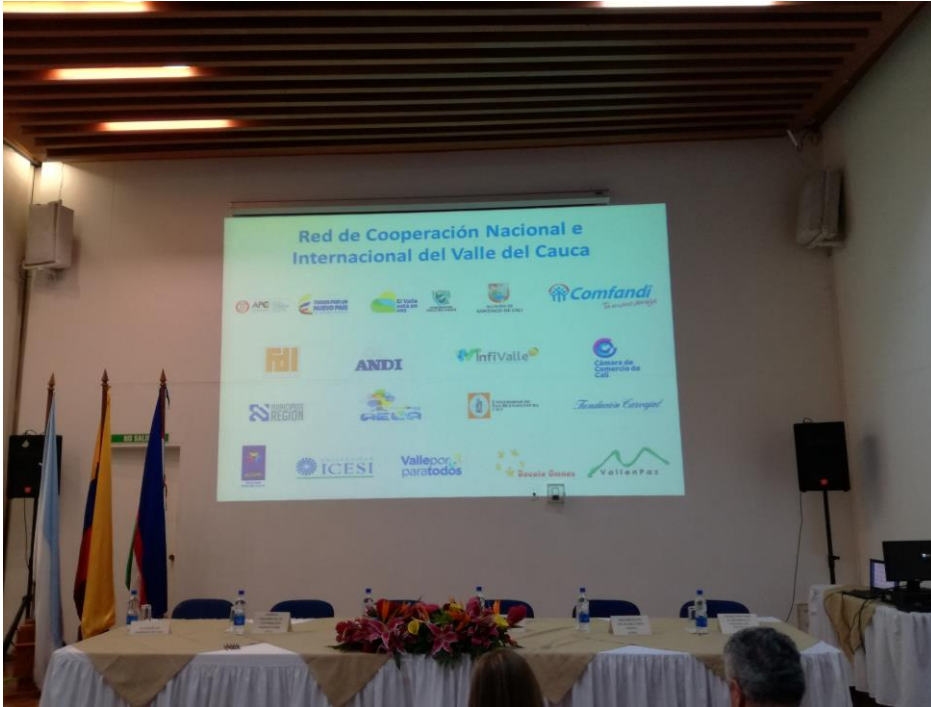
Firma del Acuerdo de Voluntades de la Red de Cooperación Internacional del Valle del Cauca