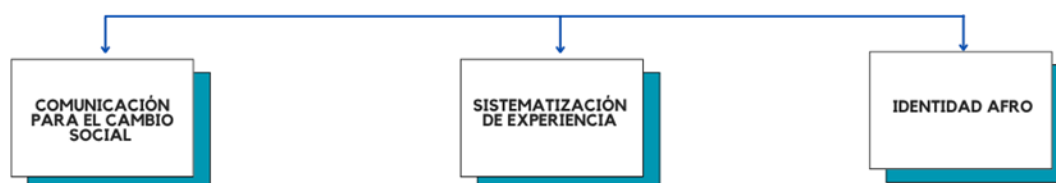
Árbol de antecedentes