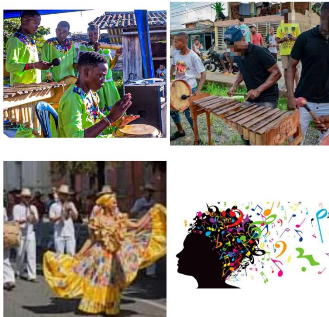
Figura 4 fotovoz percepciones sobre la música Ashe Masai

Para concluir con la presente categoría se presentarán las imágenes obtenidas con la técnica del fotovoz relacionados a las percepciones sobre la música que tienen los participantes de Ashé Masai, cabe aclarar que los testimonios relacionados a estas ya se encuentran incluidos en las categorías anteriores. (Ver figura 4).