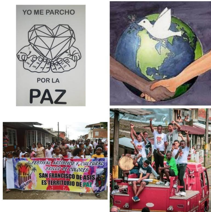
Figura 3 fotovoz percepciones sobre construcción de paz Ashe Masai