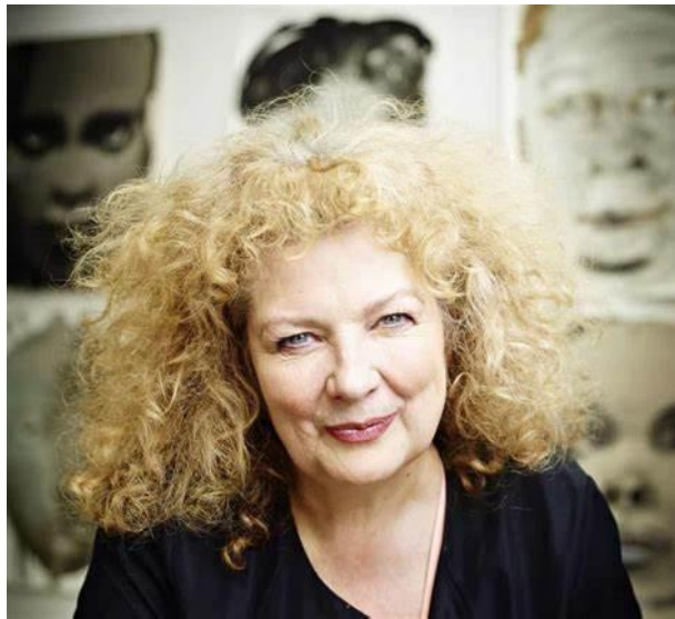
Artland Magazine, 2020 female iconoclast, fotografía

Marlene Dumas es una artista sudafricana, nacida en Ciudad del Cabo en 1953. Durante su infancia residió en Kuilsrivier, Sudáfrica, donde hablaba su lengua materna Afrikáans. Se licenció en Artes Visuales en la Universidad de Ciudad del Cabo en 1975. es una gran pintora y artista, que enfatiza el cuerpo humano y el valor psicológico, pintando personas desde que nacen hasta que mueren. El ciclo de la vida manifiesta sus ideas sobre lo social, sexual o racial. Conserva apariencias sin concluir, con trazos de dibujos ligeros, casi ocultos, tal vez dramáticos. Dumas expresa imágenes prestadas, convirtiéndolas en confusas dentro de un terreno oscuro. (Clelia, s. f.)