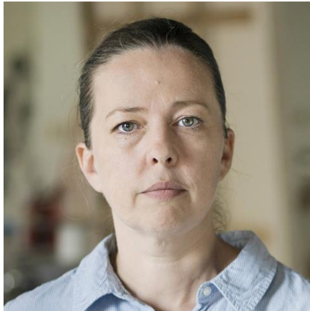
Sotheby's 2019 Art, biography and Art for sale, fotografía

Jenny Saville: su interés por la pintura figurativa frente a la abstracción o el arte multidisciplinar practicados por sus coetáneos. En sus lienzos, la artista superpone capas de óleo, carbón, pastel y otros materiales, al tiempo que amontona cuerpos y rostros que se fusionan en transparencias orgánicas. Su técnica provoca una combinación de abstracción y realismo llena de potencia y de sensualidad, y que al mismo tiempo genera una sensación inquietante y perturbadora. Jenny Saville ha continuado con su investigación sobre la representación pictórica del cuerpo y el rostro humano, sin abandonar preocupaciones muy presentes en su obra como son la cuestión de género, la estética no normativa y la lucha feminista. (Sánchez, s. f.)