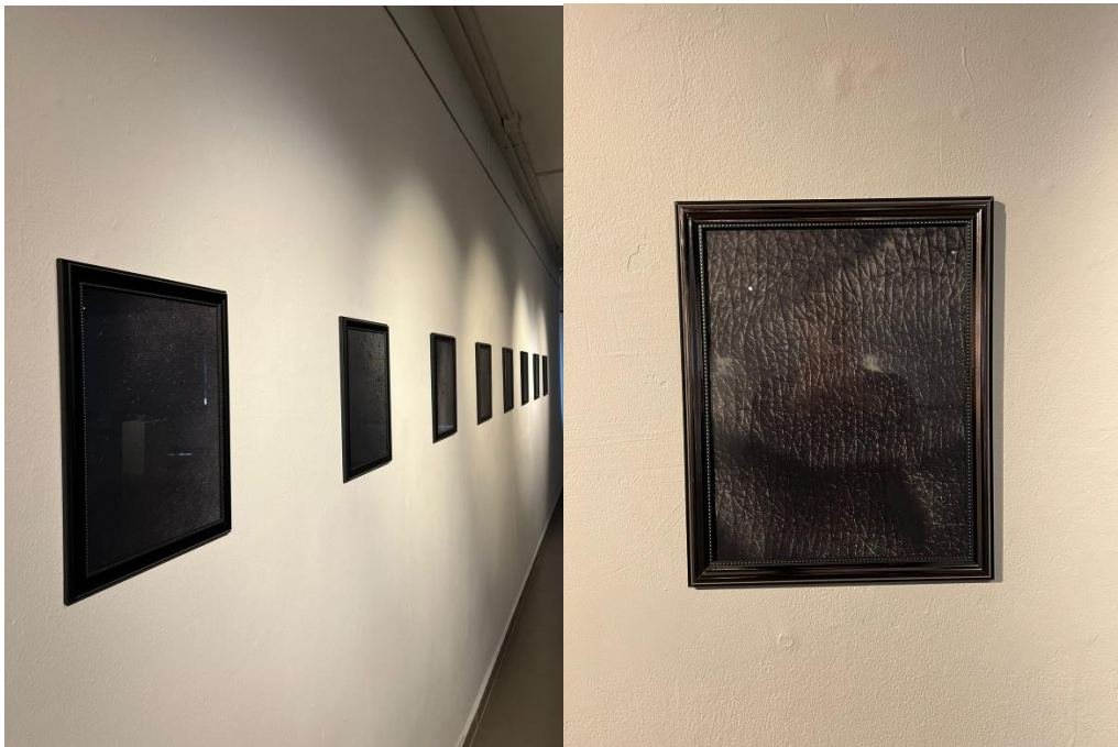
Imagen 06 – 07 – 08