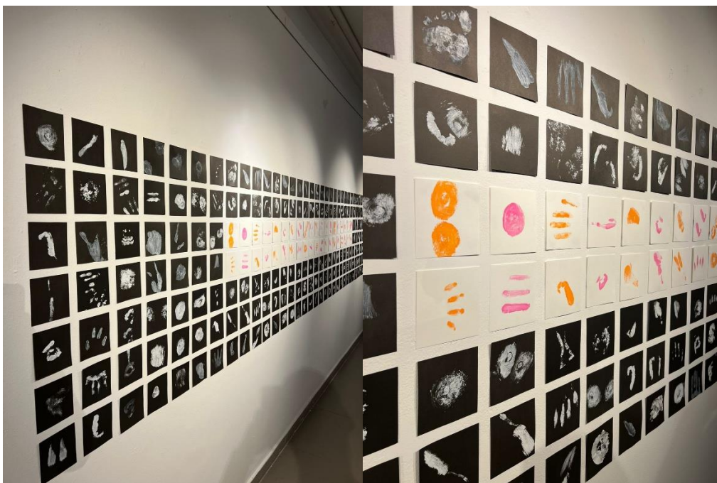
Imagen 03 – 04 – 05