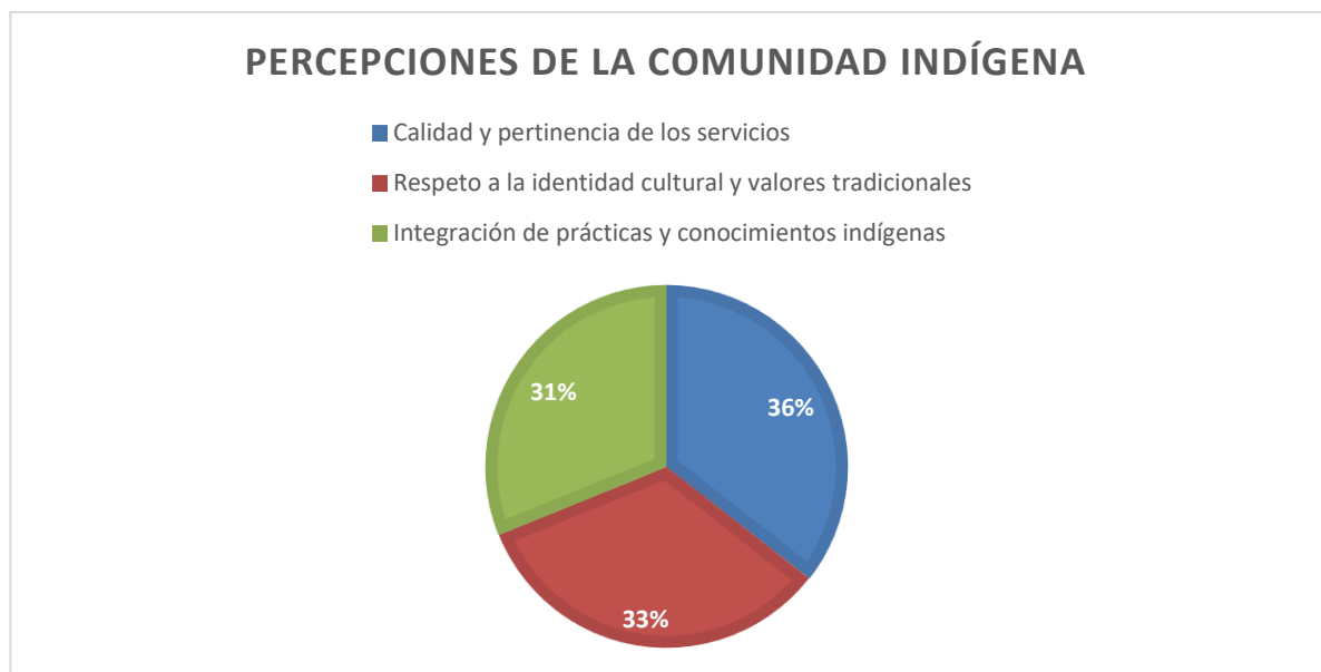
Figura 2. Percepciones, experiencias y necesidades de la comunidad indígena