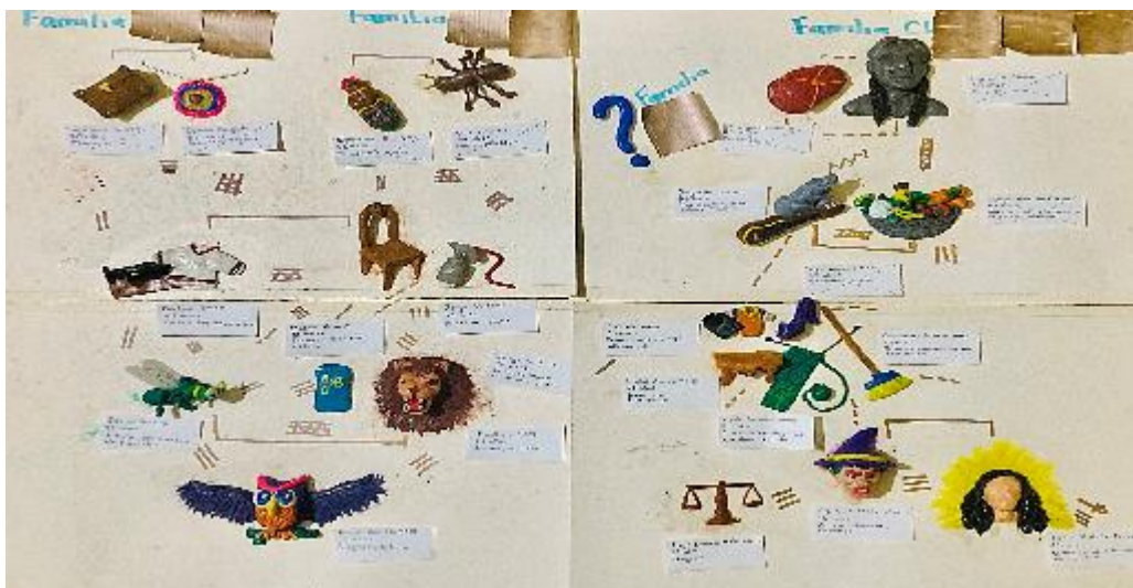
Fotografía 7. Genograma Familia Medina Vela (MV).

A continuación se muestran imágenes de la construcción de los genogramas por parte de los y las integrantes de las familias.