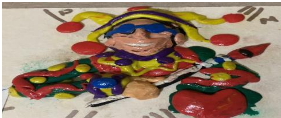
Fotografía 15. Simbolización de hombre carnalero, padre (OE).

A manera de conclusión para las dos familias, es posible agregar que en tanto hombres como mujeres viven y se sienten hacedores de las carrozas, se logran ciertas fisuras en la rigidez de los imaginarios sociales del patriarcado basados en la subordinación.