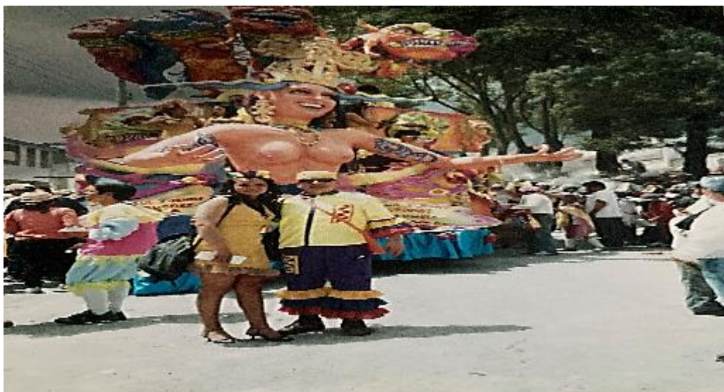
Fotografía 5. Carroza “Colombia, la caja de Pandora”.