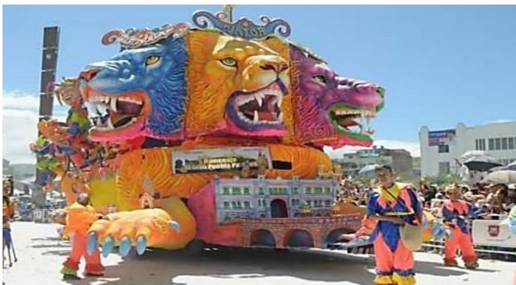
Fotografía 6. Carroza “Homenaje al gran pueblo pastuso”.