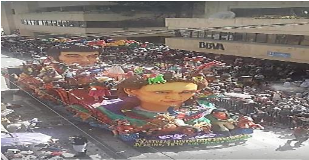
Fotografía 4. Carroza “Pastusas invencibles derrotando a Nariño 1814”.

Las fotografías elegidas por la familia (OE) son las siguientes: