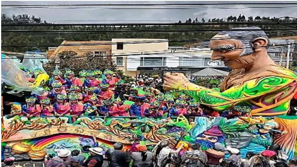
Fotografía 3. Carroza “La naturaleza es mi casa”.

Las fotografías elegidas por la familia (OE) son las siguientes: