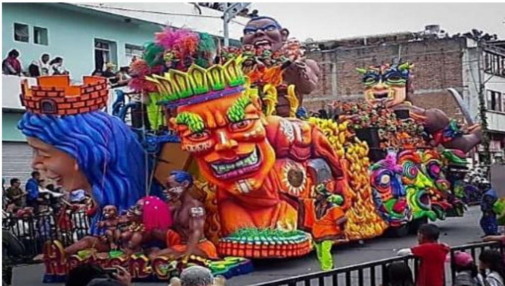
Fotografía 2. Carroza “Herencia”.