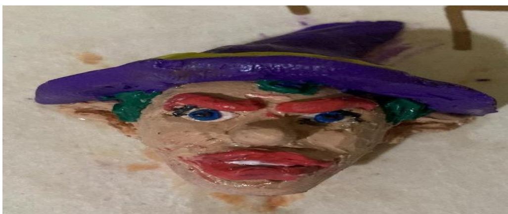
Fotografía 13. Sibolización de duende, esposo (MV).

Esta es la imagen de su personificación: