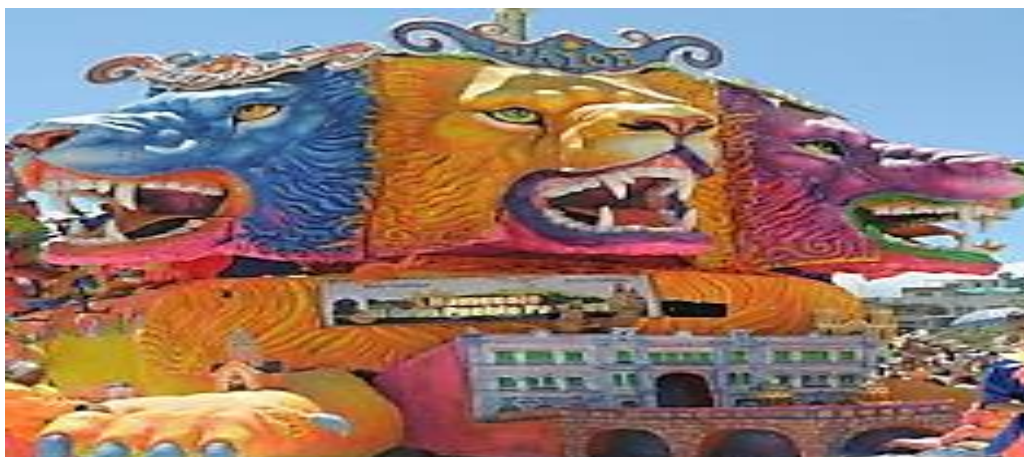
Fotografía 9. Fragmento, carroza “Homenaje al gran pueblo pastuso”.

El primer objetivo específico de esta investigación busca develar conjuntamente con los y las artistas, la construcción de los significados que de lo masculino y lo femenino se expresan en los propósitos comunicativos de los motivos de las carrozas. Estos propósitos están profundamente relacionados con el universo simbólico, que da cuenta del sentido de lo masculino y lo femenino agenciados en las interacciones cotidianas de los y las participantes. En este sentido, la subcategoría definida “Construcción de significados del mundo de lo femenino y de lo masculino”, posibilita leer de manera amplia este universo simbólico.