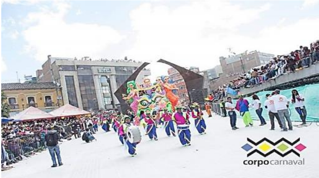
Fotografía 1. Carroza “Qué locura, fiesta y literatura”.