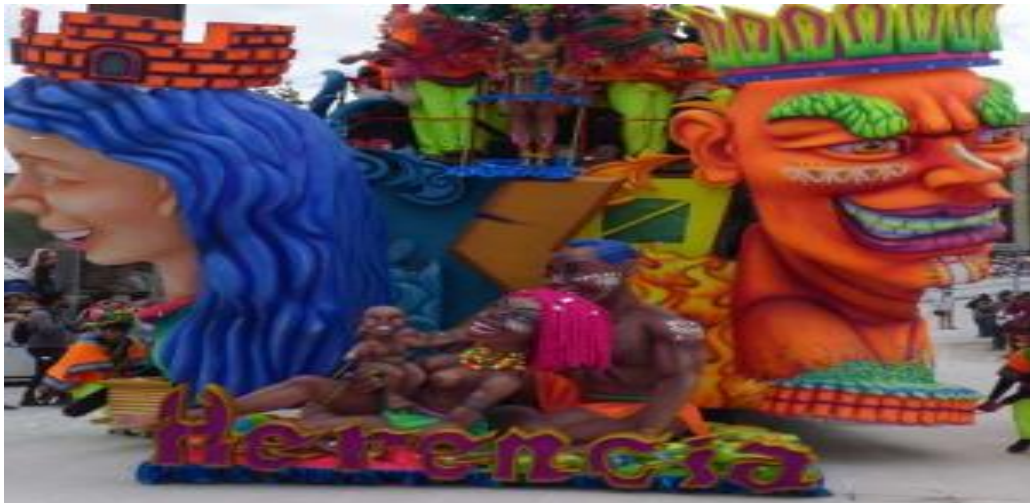
Fotografía 10. Fragmento Carroza “Herencia”.

El segundo objetivo específico de esta investigación pretende identificar desde una perspectiva de género, cómo se dinamizan los saberes del Carnaval al interior de las familias de