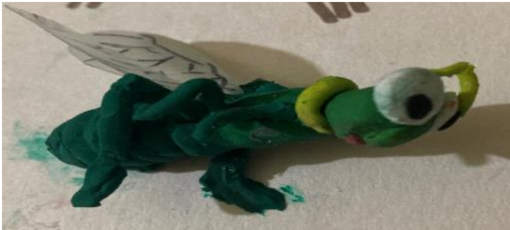
Fotografía 12. Simbolización de cigarra, esposa (MV).

Su esposo se personificó como un duende y manifestó que se sintió identificado debido a que: