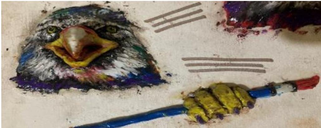
Fotografía 14. Simbolización de águila, hija (OE).

Esta es la imagen con la figura que representó: