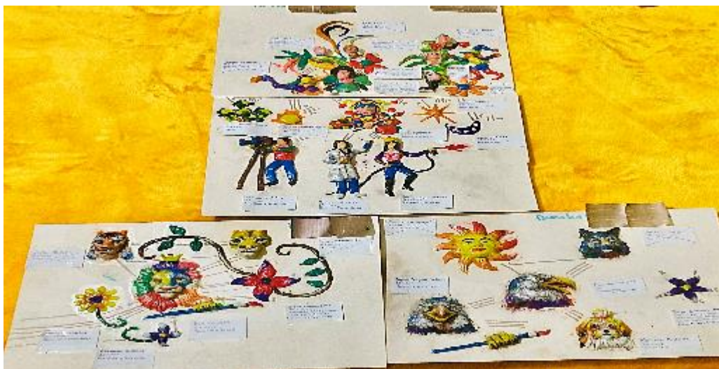
Fotografía 8. Genograma Familia Ortiz Estrada (OE).