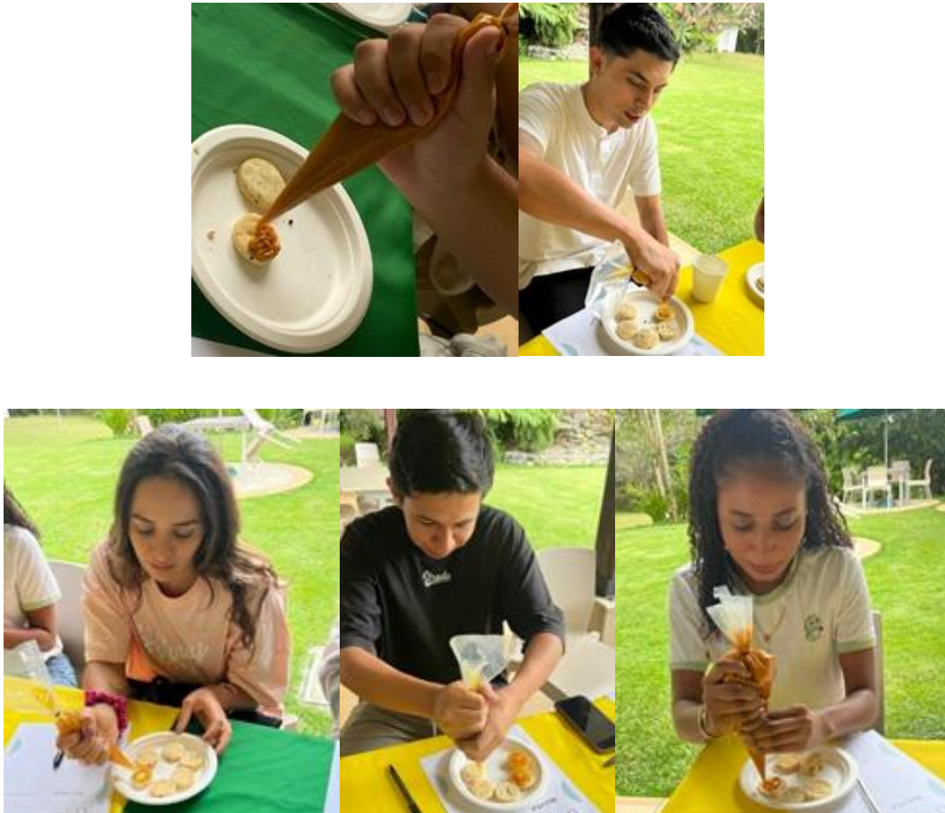
Figura 17: Realización de alfajores.

la parte de organoléptica de estos, ya que podían probar por separado los rellenos y las galletas, al igual que ya sus sabores combinados, después de haberlos armados.