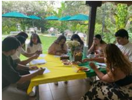
Figura 18: Los participantes realizan el recetario

nombre de la receta, los ingredientes, el paso a paso y el por qué se identificaba con ella. Se obtuvo un gran resultado por parte de los participantes.