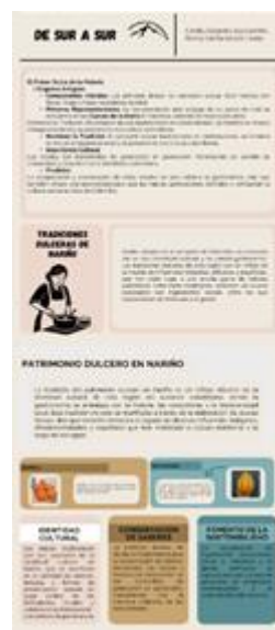
Figura 9 Infografía informativa.

Resultado de la infografía informativa sobre los temas tratantes en el trabajo.