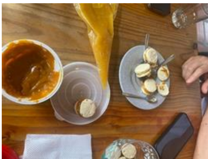
Figura 10 : Primer laboratorio y presentación al asesor gastronómico.

presentación como el producto final. Hubo sugerencias por parte de los dulces como sus texturas y su fluidez, en la galleta fue por su forma desigual y distintos grosores que había entre sí. Por este motivo el asesor gastronómico propuso aumentar el tiempo de cocción y reducir la cantidad de líquido en los dulces y en las galletas utilizar como ayuda bases de una misma altura para que sea del mismo grosor.