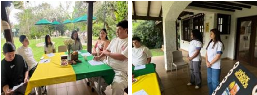
Figura 14: Charla inaugural.

Este fue el inicio de nuestro encuentro con los participantes, en donde las investigadoras comenzaron explicando sobre el tema del proyecto y cuál fue la inspiración que se tomó para realizarlo. Se realizó una contextualización a las/os participantes respecto a los frutos que se utilizaron y el enfoque participativo de la actividad.