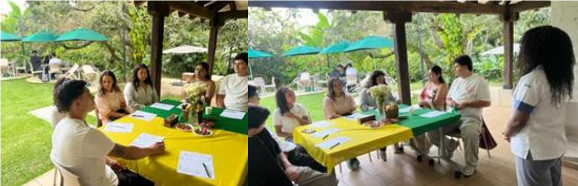
Figura 16: Mesa redonda con participantes.