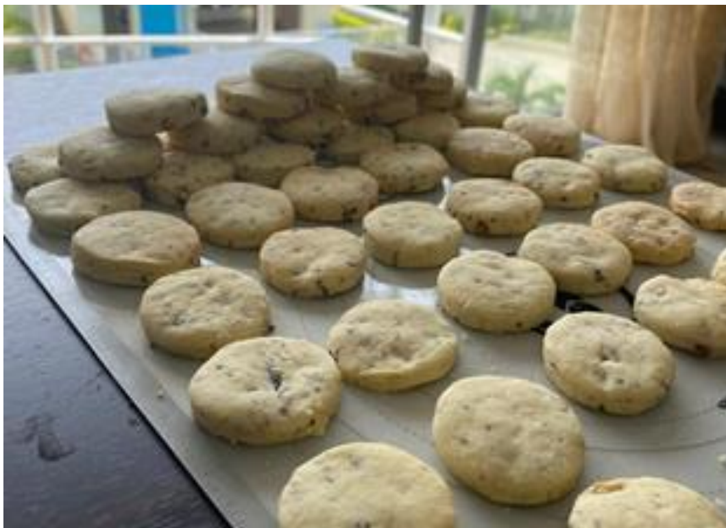
Figura 11: Prueba final con las recomendaciones del asesor gastronómico.