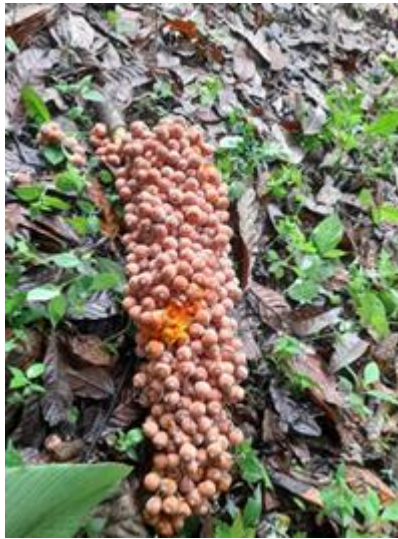
Figura 1: Fruto de guínul

Nota: fruto del guínul.