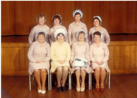
Photography and Life Stories from across The Black Country