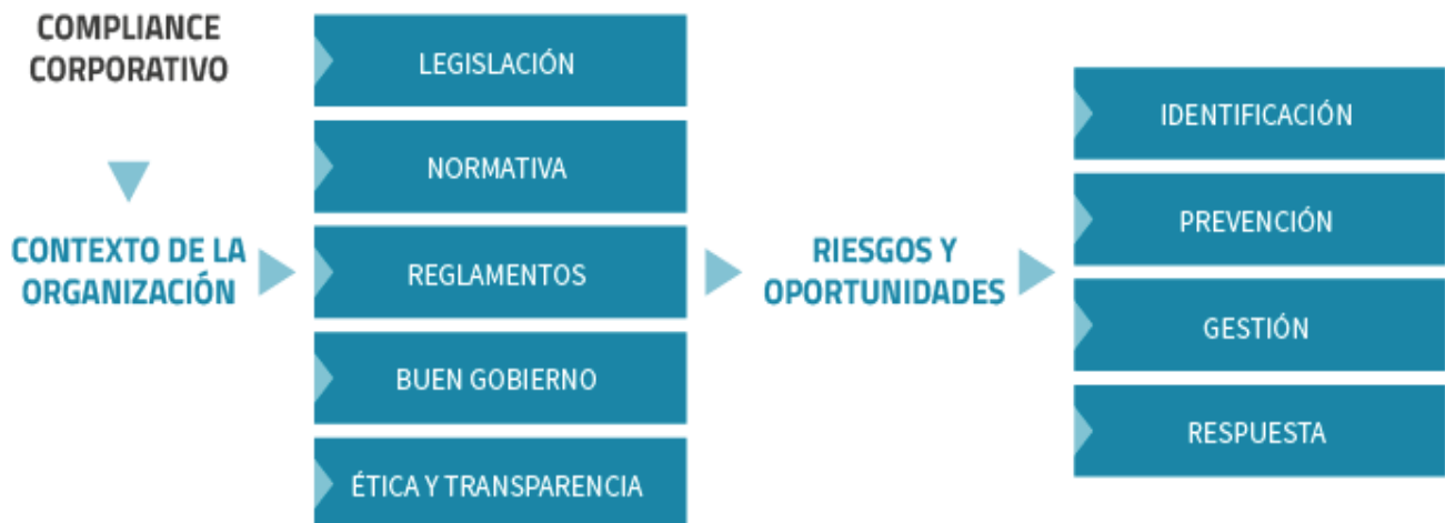
Figura 1. Proceso de elaboración de un Programa de Compliance

Nota: Tomada del sitio web del World Compliance Association http://www.worldcomplianceassociation.com/que-es-compliance.php ,