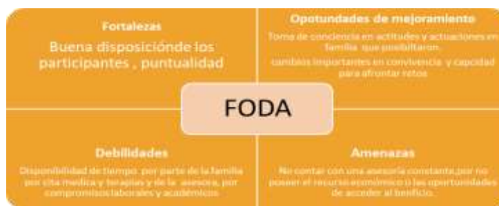
Figura 4 Matriz, FODA

Nota. La figura muestra las fortalezas, oportunidades, amenazas y debilidades. Elaboración propia. Elaboración propia.