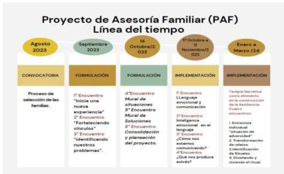
Línea de del tiempo del PAF

Nota. Esta figura muestra las actividades realizadas durante el desarrollo de cada una de las fases del PAF. Elaboración propia.