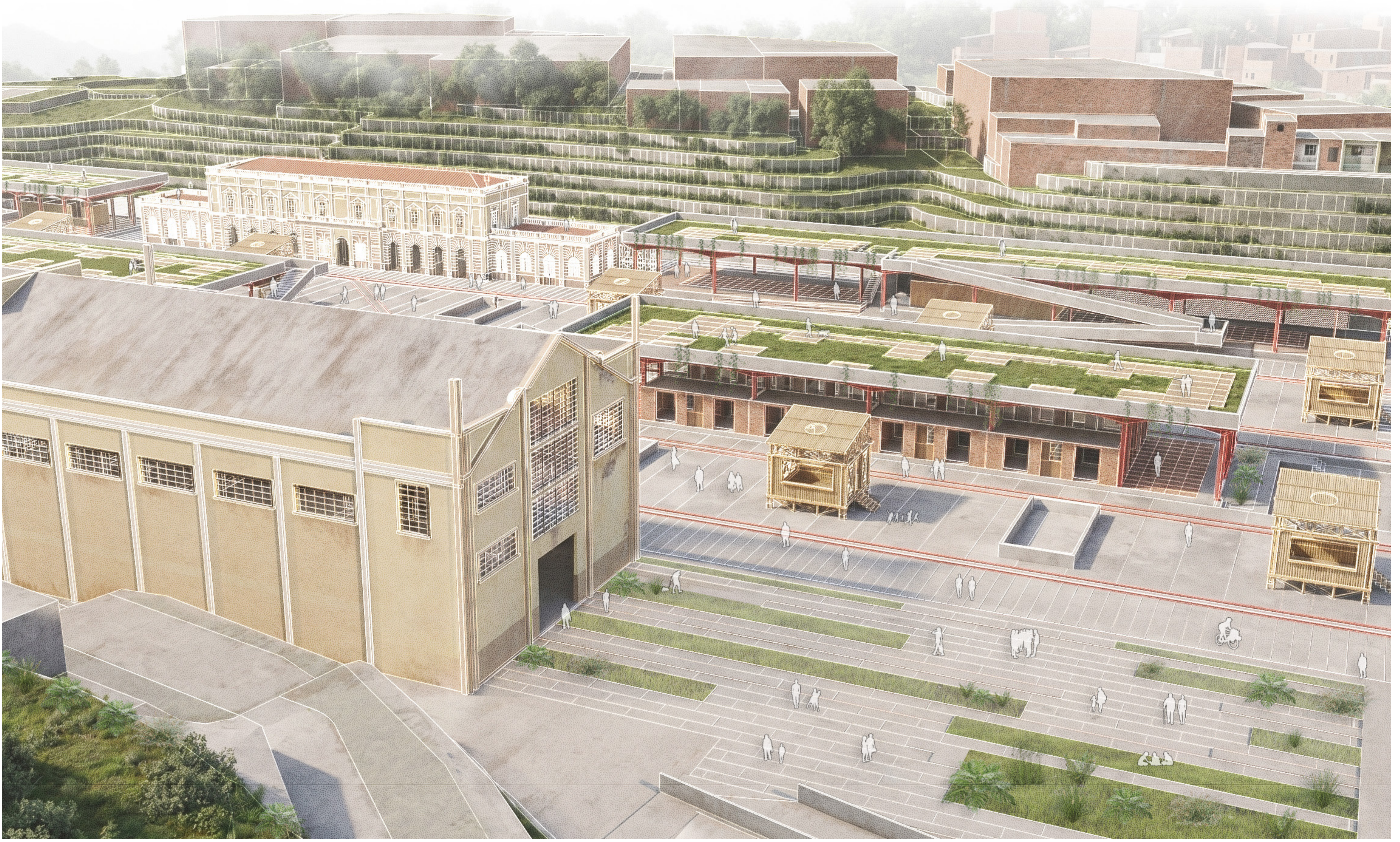
VISTA AÉREA Programa arquitectónico