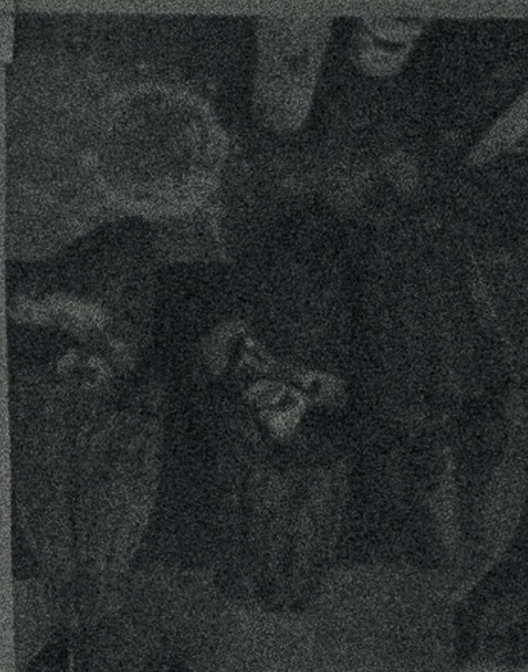
En la actualidad están principalmente dedicados a la producción de cacao criollo, mestizo e híbrido.