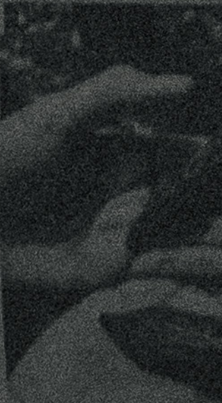
En la actualidad están principalmente dedicados a la producción de cacao criollo, mestizo e híbrido.