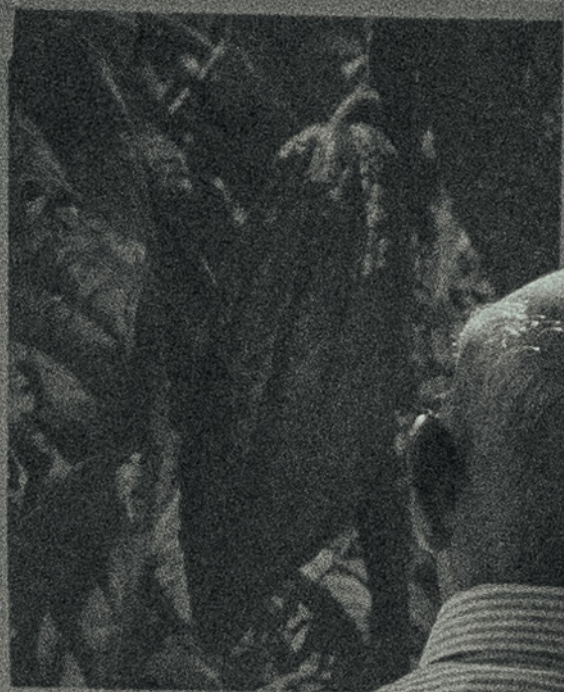
En diferentes momentos de la historia...

La familia Capino Magulón es una familia de cacao y legado, herencia, un generador de vínculos, la historia y la identidad cultural de las comunidades que trabajan en el cultivo.