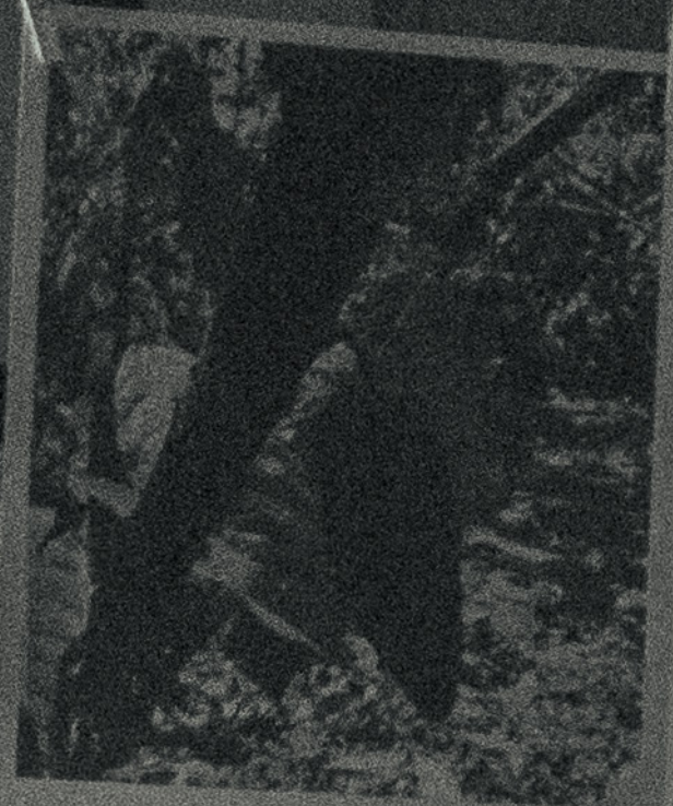
de este región y promoviendo su conservación, reconociendo el gran impacto que tiene en la identidad cultural de las comunidades de la zona.