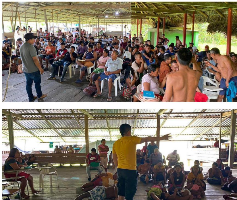
Figura 1. Orientación de formación política y pervivencia cultural desde el sentir ancestral. Comunidad de La Iguana, López de Micay. Fuente: Fotografía de Iván Barquero Ch., presidente de AZBESCAC (3 de marzo de 2024).

En consecuencia, la transmisión de esta Ley de Origen no obedece a una implementación curricular formal, sino que se materializa a través de dinámicas de socialización primaria y oralidad. Es al interior del núcleo familiar extenso donde padres, abuelos y tíos asumen la responsabilidad pedagógica, convirtiendo la cotidianidad del hogar en el espacio fundamental donde se asegura la reproducción cultural frente a las amenazas externas.