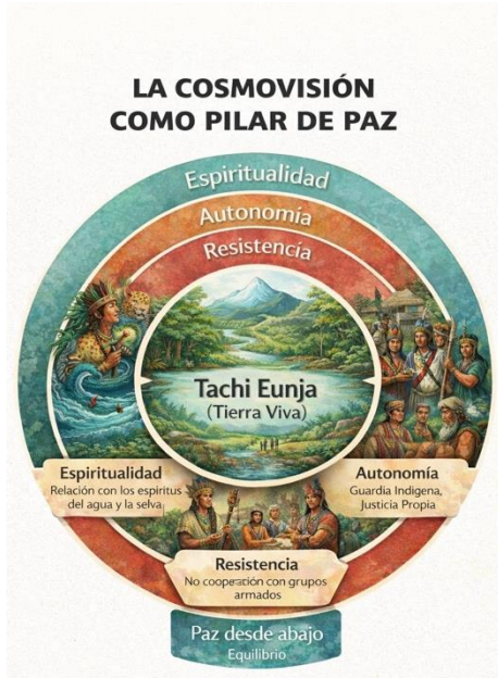
Figura 1. Modelo de construcción de paz ontológica del pueblo Eperara Siapidara.

De esta manera, la defensa de la Tachi Eunja (Tierra Viva) y su identidad es la manifestación Derecho Propio ancestral. Comprender la historia de este pueblo es, necesariamente, analizar cómo han ejercido y defendido esta capacidad de autogobierno a lo largo del tiempo, convirtiendo la autonomía en una realidad vivida y confrontacional, y no en un mero ideal abstracto.