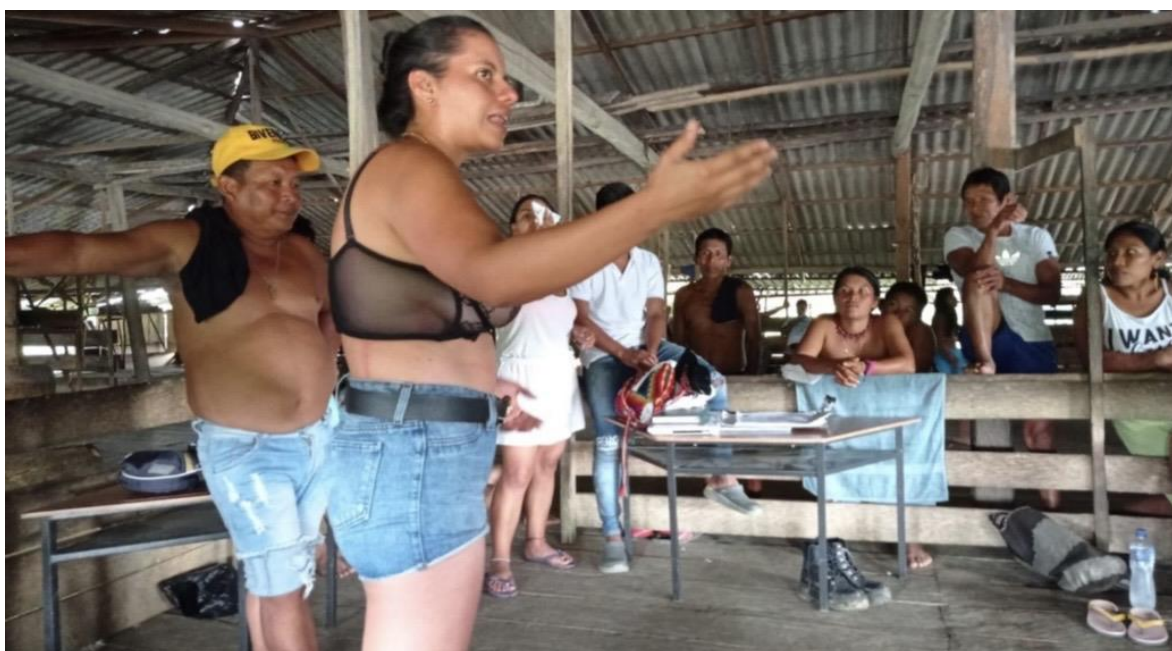
Figura 2. Fortalecimiento de la Gobernanza Propia: Jornada de socialización y coordinación entre la Justicia Especial Indígena y la Justicia Ordinaria. Este ejercicio reafirma la autonomía política plasmada en los mandatos de la organización.

Ahora bien, el pueblo Eperara Siapidara ha desarrollado una sofisticada estrategia de agencia política y jurídica híbrida para garantizar su pervivencia. Este enfoque se materializa a través de las Asociaciones de Cabildos, tales como ACIESCA (en Cauca), ACIESNA (en Nariño) y AZBESCAC (Zona Baja, López de Micay, Timbiquí, y Guapi en Cauca), las cuales desempeñan un papel crucial no solo como voceras, sino como Autoridades Tradicionales de Carácter Público Especial reconocidas por el Estado.