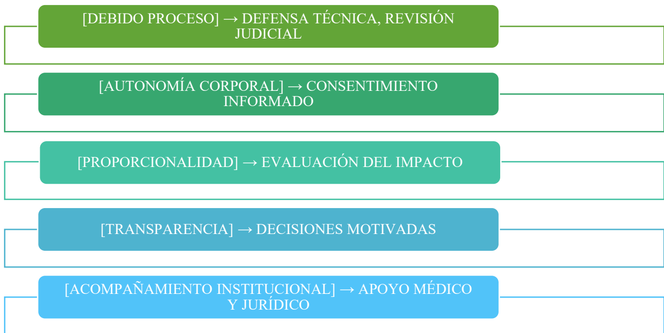
Figura 4. Principios garantistas para el sistema antidopaje colombiano