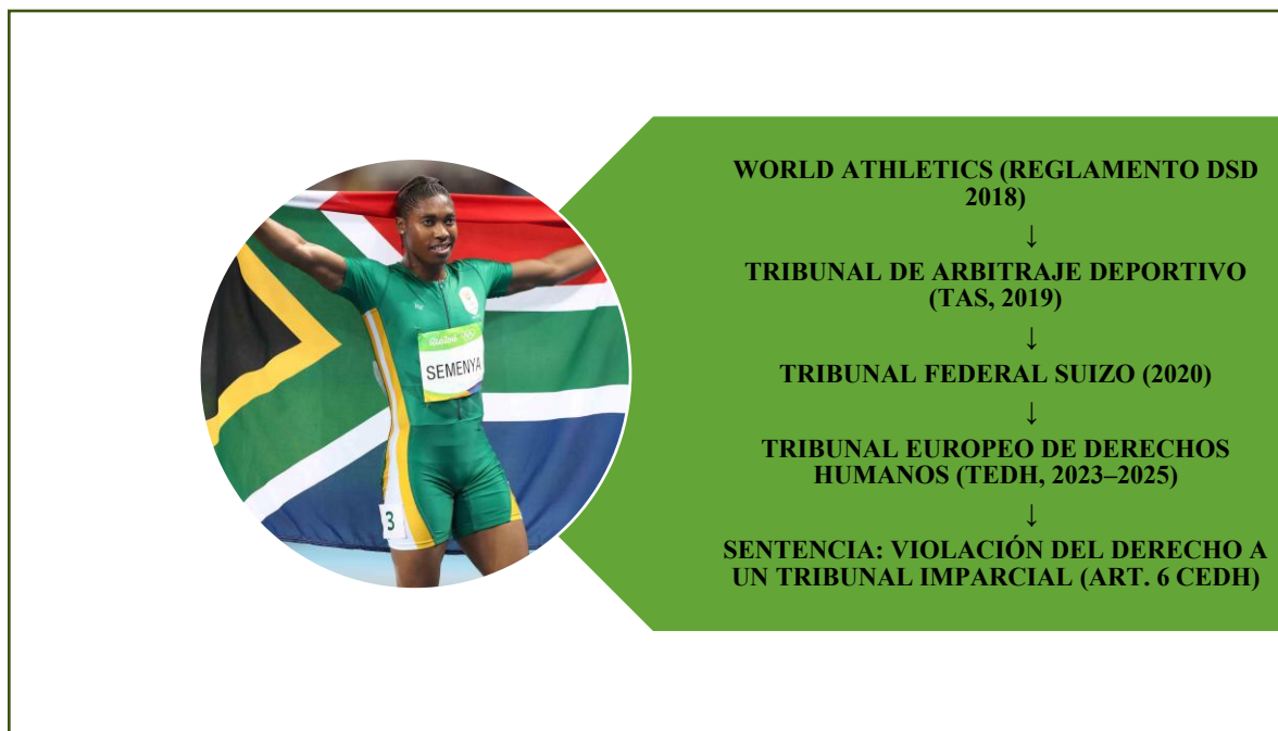
Figura 1. Ruta jurídica del caso Semenya (2018–2025)