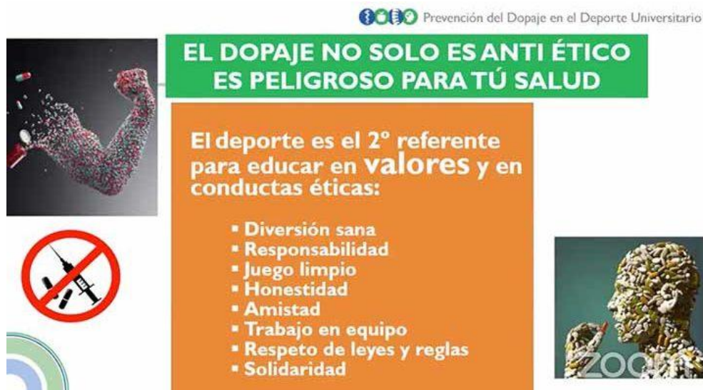
Ilustración 2. Prevención del dopaje en el deporte universitario: ética, salud y valores formativos