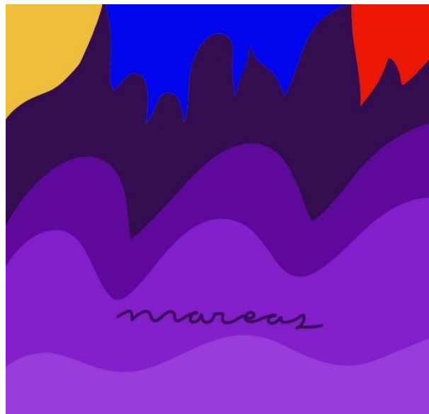
Gráfico 1. Ilustración de portadas del podcast Mareas

https://open.spotify.com/episode/61qfdCgaNwtE0T9342n7RR?si=0dd1c32ba5fb43d3