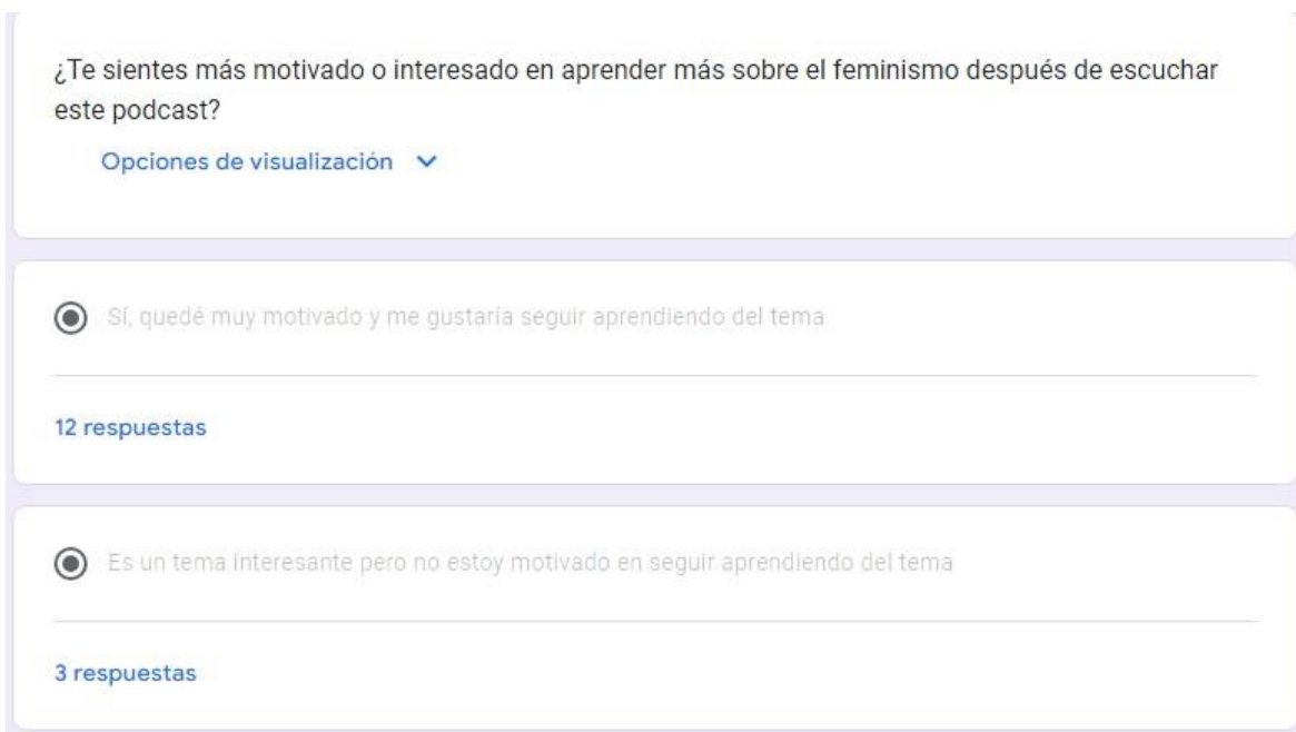
Gráfico 11. Pregunta 9: ¿Te sientes más motivado o interesado en aprender más sobre el feminismo después de escuchar este podcast?