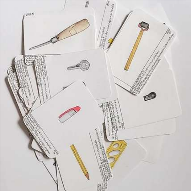
Nota. Dibujo sobre papel. 2008-presente. 17x12cm c/u.