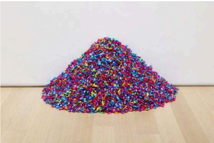
Nota. Instalación. 1991. Dimensiones variables por instalación; peso ideal de 175lbs. © The Felix Gonzalez-Torres Foundation.