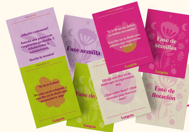
28 tarjetas con retos y consejos