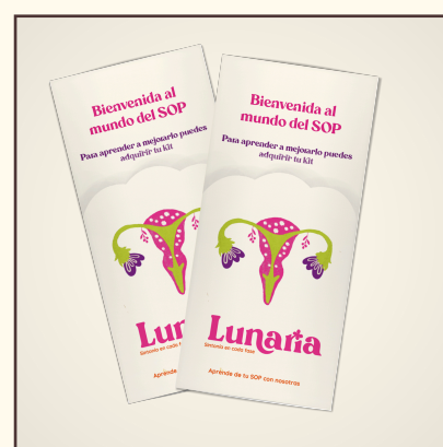
Folleto Informativo y promocionando el Kit