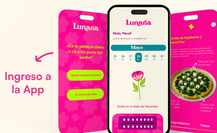
Ingreso a la App