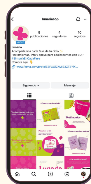
Compra por redes