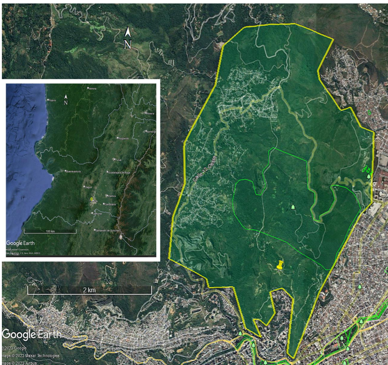
Fig 2: Mapa detallado de los Andes occidentales colombianos que presenta la ubicación del Cerro de las Tres cruces, el cual se encuentra en Cali- Valle del Cauca. El mapa se produjo en Google Earth Pro-Versión 7.3