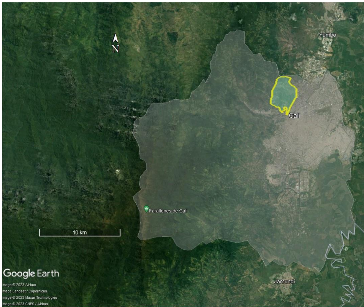
Fig 1: Cerro de las tres cruces respecto a Cali. El mapa se produjo en Google Earth Pro-Versión 7.3