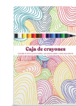
Cajita de colores