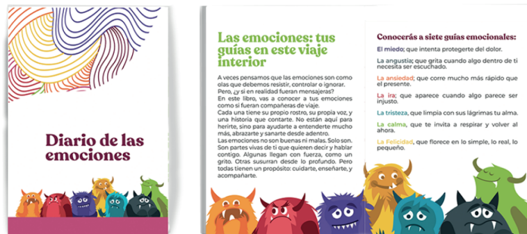
Diario de las emociones