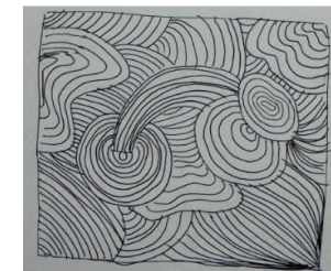
Experimentación de líneas