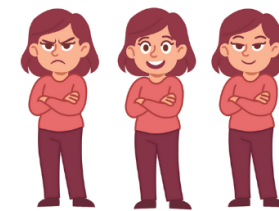
Humanos en emociones