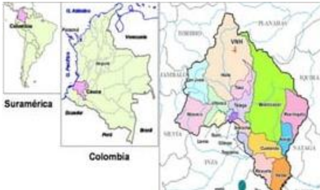
Gráfica 1. Ubicación Resguardo indígena Belalcázar

La presente investigación se desarrolla en el Resguardo indígena de Belalcázar, ubicado en el municipio de Páez, departamento del Cauca. Se trata de un Resguardo colonial que, según datos de la Agencia Nacional de Tierras, no cuenta con Acuerdo de Constitución. En el siguiente mapa se observa su ubicación geográfica. El Resguardo de Belalcázar es habitado por comuneros pertenecientes al pueblo indígena Nasa/Páez y hace parte de la Asociación de Cabildos Nasa Çxhãçxha, que conforma la Zona de Tierradentro del Consejo Regional Indígena del Cauca (CRIC) (Nasa Çxhãçxha, 2019).