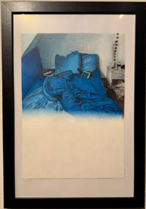
Bedroom Handmade Cotton Liquorice 100% Cotton, Handmade 10" x 12" cm