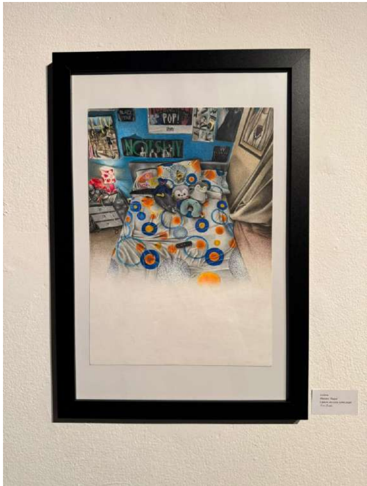
Luca Mariano Pagan Ritratto di un letto con gli animali 20 x 30 cm