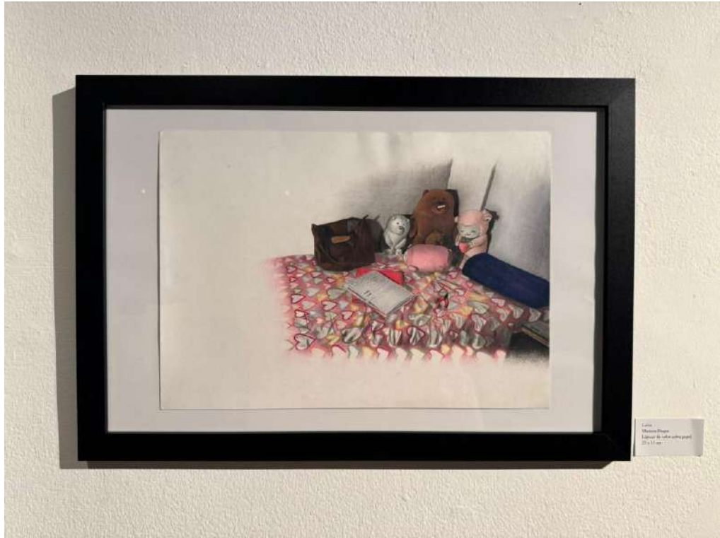
Luca Mariano Pagan Ritratto di un letto con gli animali 20 x 30 cm