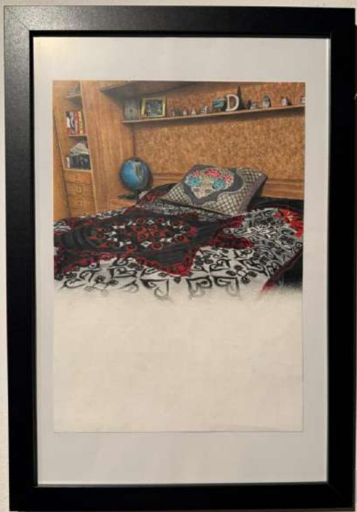
Bedroom Watercolor 18 x 24 cm