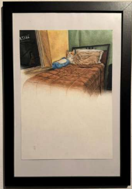
Bedroom Watercolor on paper, 10x15 cm 1911-1912