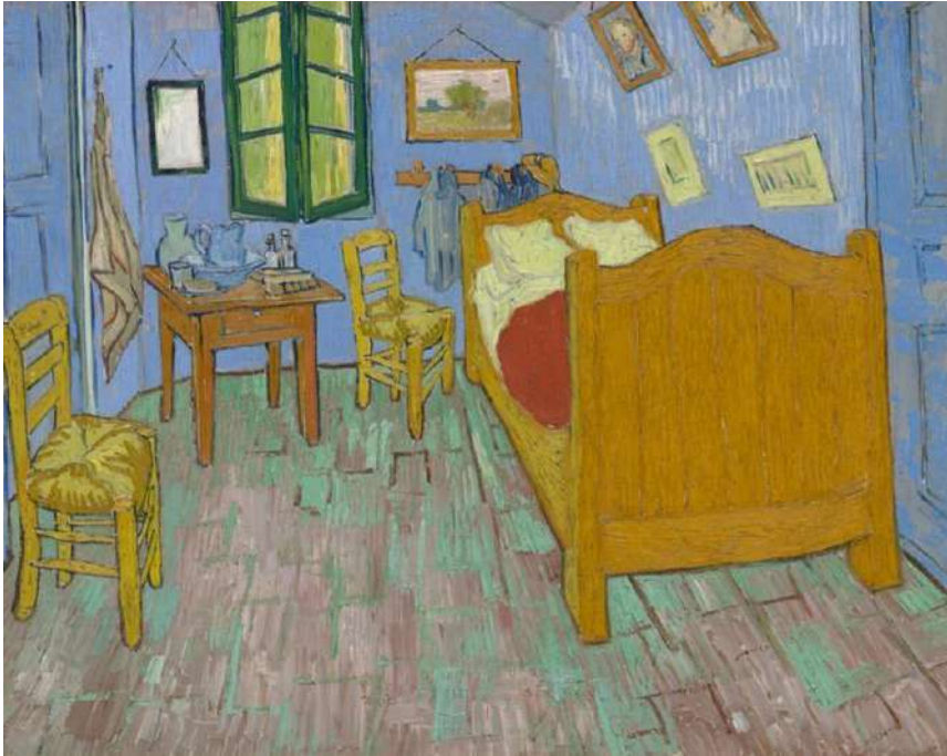
Dormitorio en Arles. 1888. Vincent Van Gogh

En esta pintura de van Gogh intenta transmitir ciertas emociones por medio de los colores y los objetos ubicados en este. El explica cada elemento en este dormitorio a detalle, expresando absoluto reposo y tranquilidad a través de estos. Esto se relaciona con mi trabajo porque en esta habitación se puede ver una intención, cada uno de los elementos y el uso del color están ubicados ahí tan meticulosamente que se puede ver reflejada la intención de van Gogh