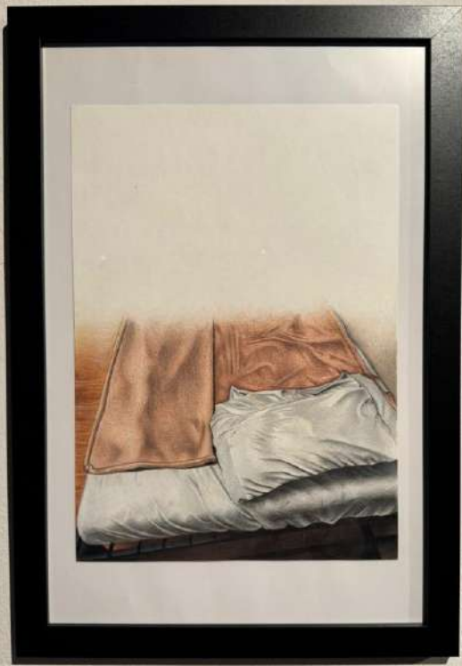
Bed Watercolor 18 x 24 cm