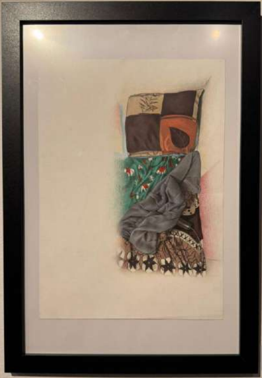
The Quilt Quilted Cotton Liquorice 100% Cotton, Handmade 10" x 12" cm