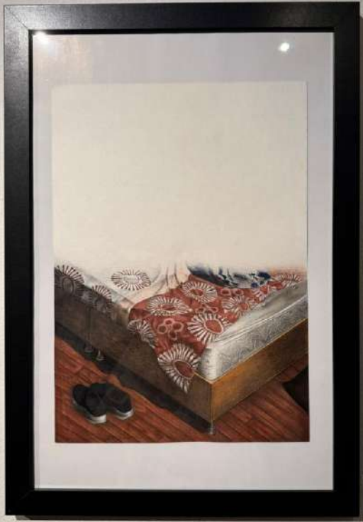
Bedroom Watercolor on paper, 10x15 cm 1911-1912