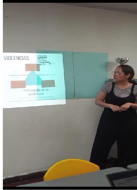
Segundo taller con el consejo estudiantil.