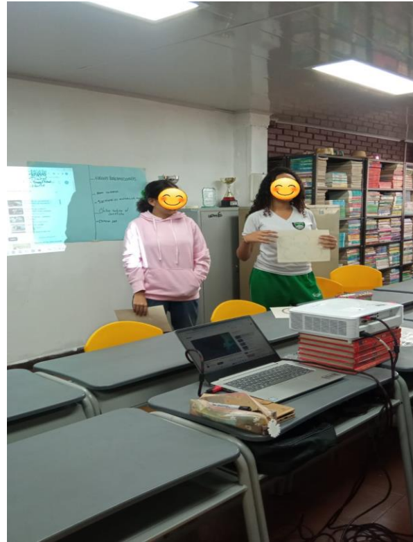
Actividad final del segundo taller sobre cultura de paz, donde los estudiantes (consejo estudiantil) elabora representaciones de paz (ilustran)