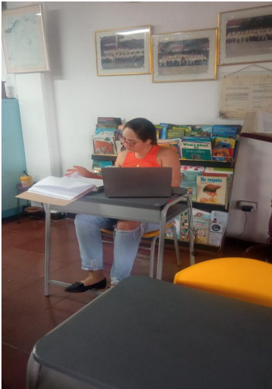
Realizando revisión documental en la institución.