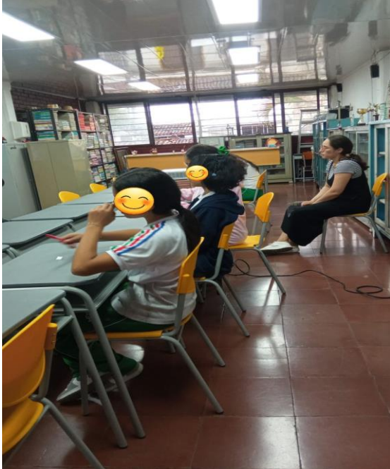
Tiempo de proyección de video los círculos de paz. (Resolución de conflictos)