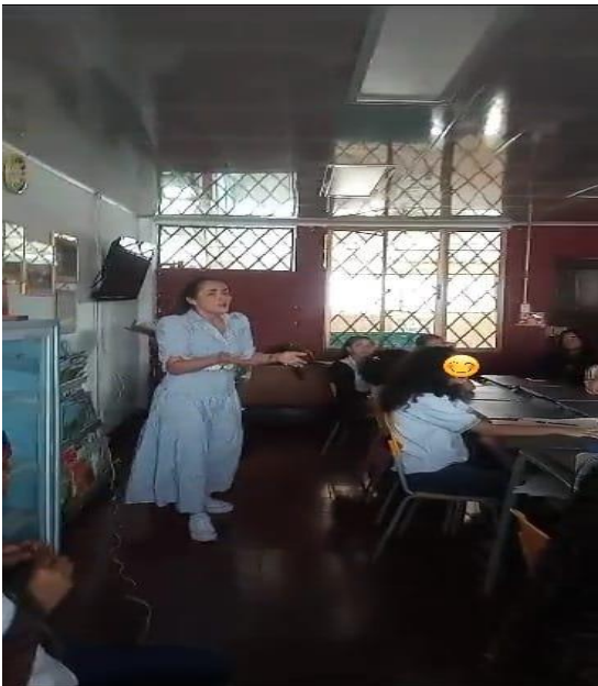
Primer taller con el consejo estudiantil