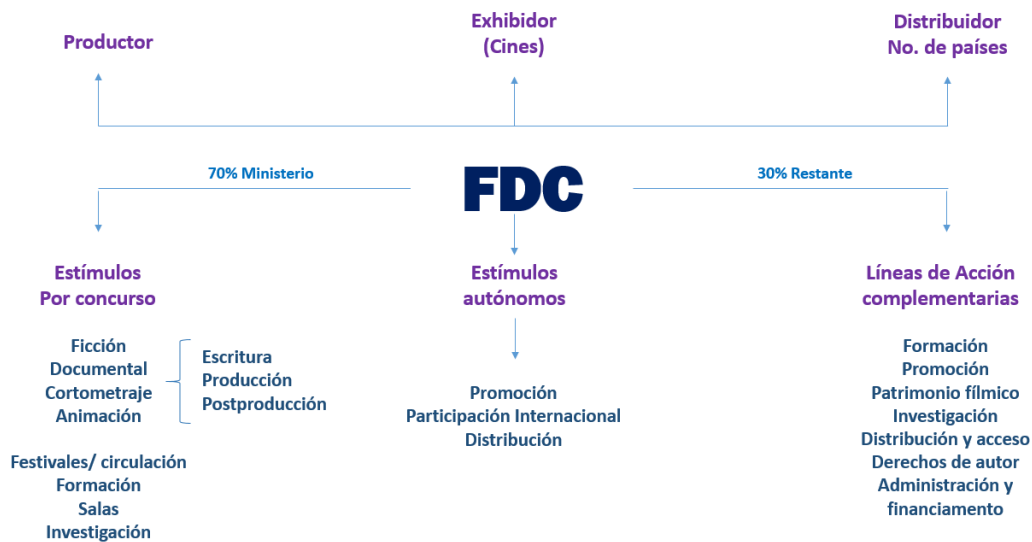
Fig. 1. Estructura del Fondo para el Desarrollo Cinematográfico y asignación de recursos según el FDC. Elaboración de la autora.

Los dineros recaudados para el FDC son utilizados para el funcionamiento y administración del mismo. Además está estipulado que al menos un 70% debe destinarse a la creación y promoción de largometrajes y cortometrajes colombianos. Los dineros del FDC que tienen esta finalidad se entregan como estímulos por concurso o estímulos automáticos, siendo los primeros una convocatoria pública con diferentes categorías tanto para documental como para ficción en las etapas de desarrollo, producción y posproducción. Mientras que los estímulos automáticos son para promoción, participación en eventos internacionales y distribución. El porcentaje restante se distribuye en líneas de acción complementarias al fomento audiovisual tal como se observa en la siguiente figura: