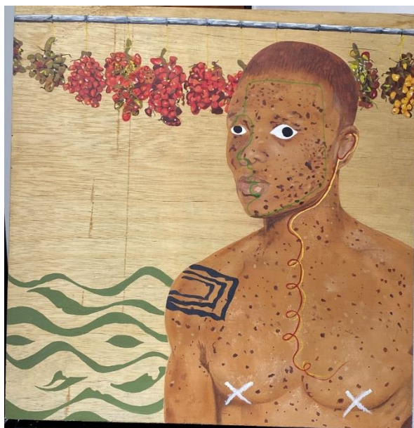
Afrodisíaco. Acrílico sobre Madera. 50 x 50 cms. 2023

Esta problemática es representada de manera simbólica a través del chontaduro, un fruto que, por su asociación popular con la potencia sexual, se convierte en un ícono de la reducción de la identidad afro a meros objetos de deseo. Sin embargo, al integrar el chontaduro en la pieza, busco no solo evidenciar esta estigmatización, sino también resignificarlo, recordando que este fruto, al igual que la comunidad que lo produce, es parte integral de un ecosistema cultural y natural mucho más amplio y significativo.