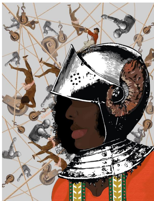
Imposición. Pintura Digital. 2021

opresión histórica y la persistencia de estas dinámicas en la actualidad, tales como cuerdas, cascos y armaduras que ocultan y tergiversan los rasgos auténticos de nuestra cultura. Los efectos de la colonización siguen vivos en la manera en que nuestras comunidades son percibidas y, en ocasiones, comercializadas sin respeto ni comprensión. Buscaba no solo criticar estas prácticas, sino también reclamar la autenticidad y el derecho a definir nuestra identidad por nosotros mismos. A continuación, se presentan las imágenes de imposición.