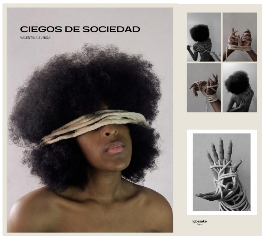
Ciegos de sociedad. Foto libro (15 páginas) 2021

que constantemente niega nuestra existencia. Esta pieza invita a una reflexión sobre la necesidad de recuperar y reivindicar nuestras identidades. Hasta el momento, es mi primer y único trabajo fotográfico que se ve alineado con mis intereses y me parece importante presentarlo dentro de mis antecedentes, porque creo que sienta una buena línea para mi creación artística.