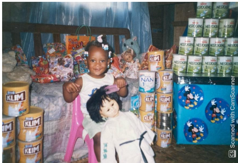
Archivo familiar. 2006 aprox.

El primer paso, es mirar el álbum familiar y reconocer en este las fotografías que hacen evidente mi relación con el cabello. Para después hacer un proceso de selección, edición y ajuste de estas. Un ejemplo de estas fotografías es de mí a los 3-4 años donde estaba peinando a una de mis muñecas favoritas del momento, actividad que, según mi madre, me encantaba hacer, al punto de que terminaba dañando el cabello de mis muñecas por jugar repetidas veces con la peineta. En esta fotografía estoy rodeada de muchos tarros de leche que mi mamá acumulaba y que yo había consumido hasta ese momento. En medio de mi plática con ella acerca de esos momentos de mi infancia, me recordó que tomé leche formulada hasta los 7 años aproximadamente y que le parecía sorprendente lo mucho que me gustaba.