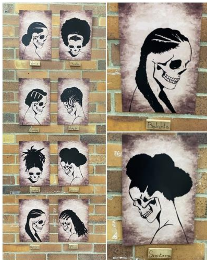
Cabello pacífico. Técnicas mixtas. 2022

El cabello afro, en esta serie de ocho piezas, es un símbolo de resistencia, continuidad y pertenencia a una comunidad que ha sabido preservar sus tradiciones a lo largo de su historia, siendo llevados por todos los ancestros que influyen a las nuevas generaciones y conservan sus valores. Este trabajo reafirma la importancia de reconocer y valorizar nuestra historia desde sus raíces más profundas.