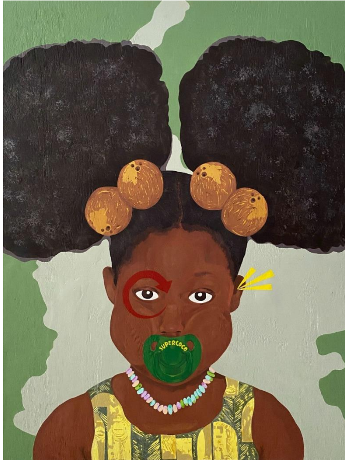
Nadjela. Acrílico sobre madera. 70 x 100 cms. 2023