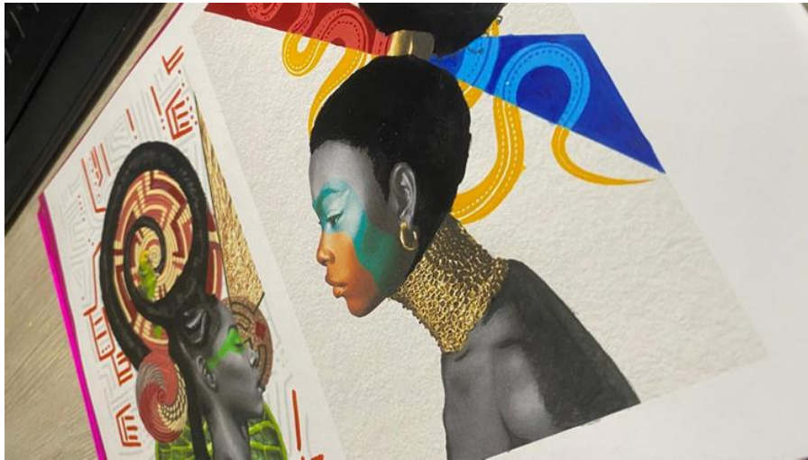
Archivo personal. 2024.

elementos presentes en la composición. La imagen a continuación, es una foto del proceso inicial de intervención de dos primeros bocetos para lo que será una serie de 12 piezas, en esta se combinan varios materiales como pintura acrílica, grafito y acuarela. Trato de darle un toque único a cada pieza y hacer que el espectador pueda quedarse observando, desglosando y analizando cada detalle del trabajo.