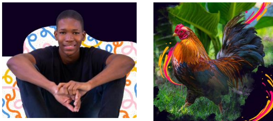
Imagen 6. Gallo de pelea, asociación con política pública de jóvenes.

C) El conflicto juvenil violento es representado a través de los gallos de pelea. También la capacidad para reaccionar frente a las injusticias que les atañen. Esto será relevante para la sección dedicada a la política pública de juventudes.