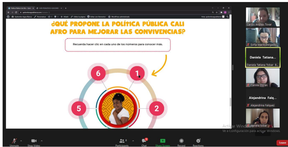
Imagen 9. Validación de página web