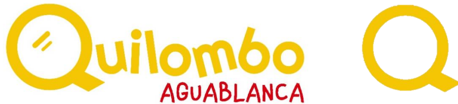
Imagen 4. Logo oficial del curso virtual Quilombo Aguablanca

A) La “Q” de Quilombo se representa como una lupa que sirve para enfatizar experiencias conflictivas de la vida social que pueden ser pensadas colectivamente.