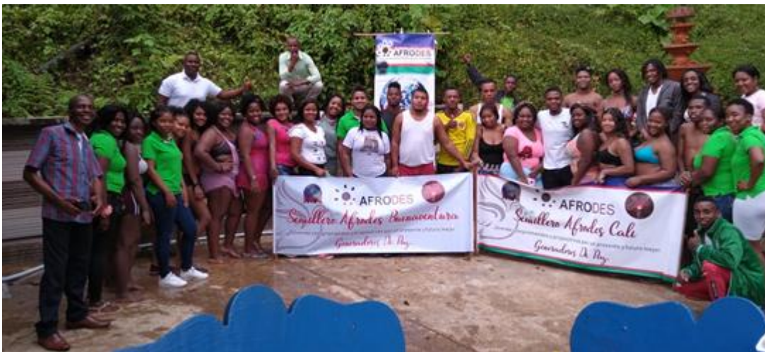
Imagen 1. Jóvenes del Semillero AFRODES

Actualmente las cifras siguen subiendo, sin embargo, la comunidad no cuenta con un diagnóstico actualizado, políticas públicas o autoridades competentes para el fortalecimiento educativo. Además de eso, los jóvenes y la comunidad están a la espera, al igual que la corte constitucional de las respuestas de la rama ejecutiva para el censo territorial en los lugares en los cuales se han llevado a cabo procesos de retorno y reubicación a territorios.