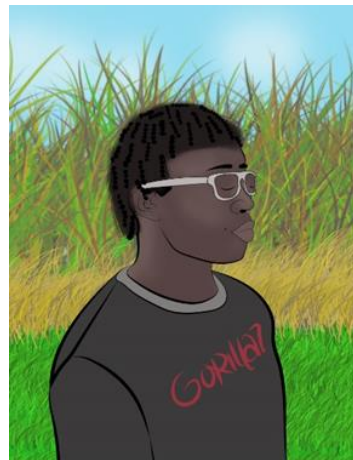
Imagen 5. Entrada de Políticas públicas de jóvenes del curso virtual Quilombo Aguablanca