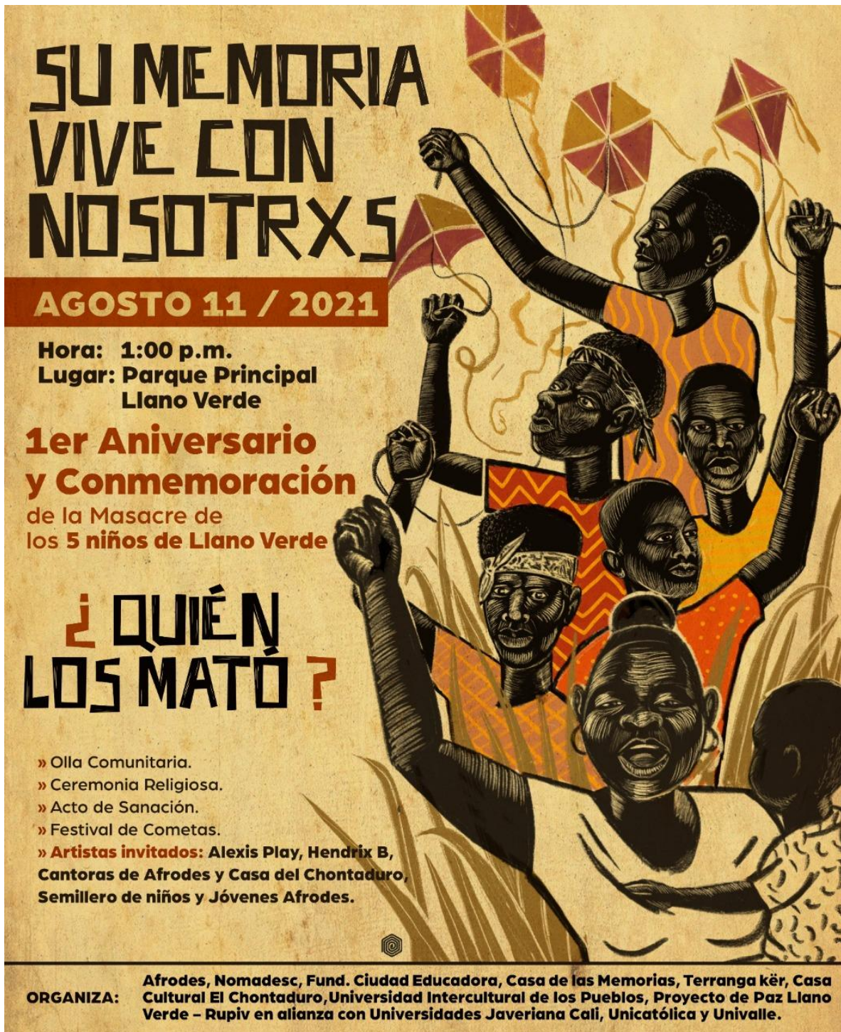
Imagen 2. Poster conmemoración de la masacre de Llano Verde.