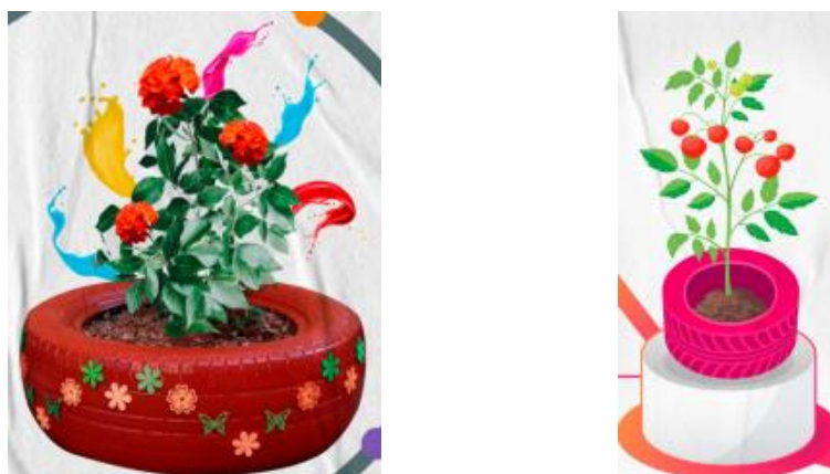
Imagen 7. Planta sembrada en llanta, asociación con política pública de víctimas

D) Las plantas sembradas en llantas refieren a los procesos de construcción de paz, los cuales se tematizan en la sección dedicada a la política pública de víctimas.