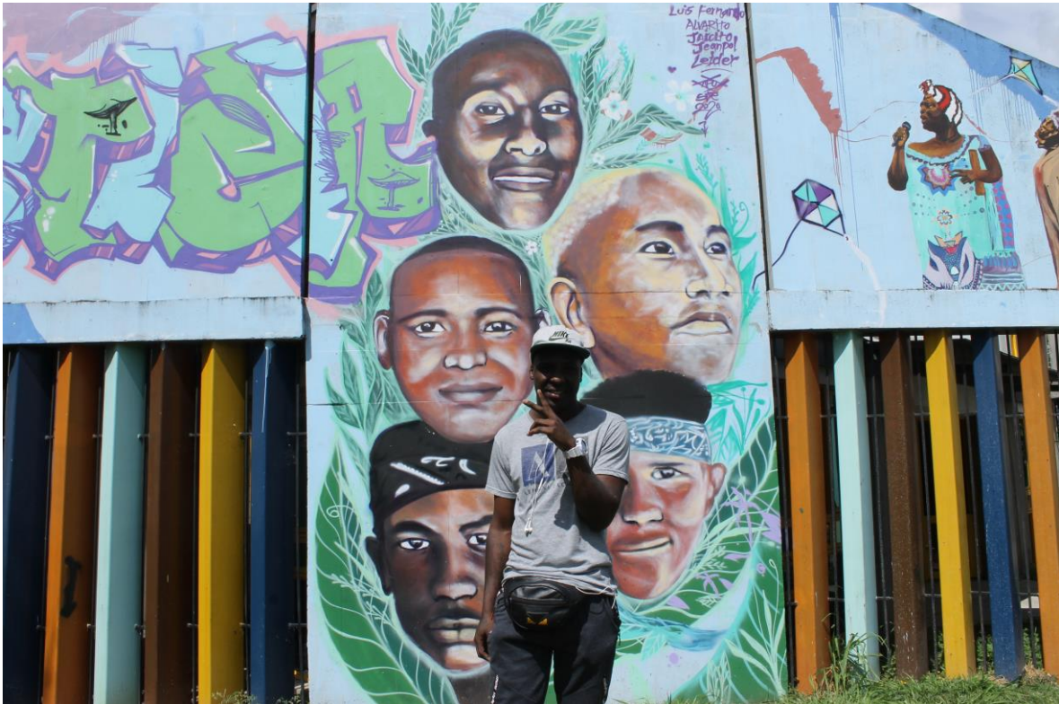
Imagen 3. Mural en el parque de Llano Verde