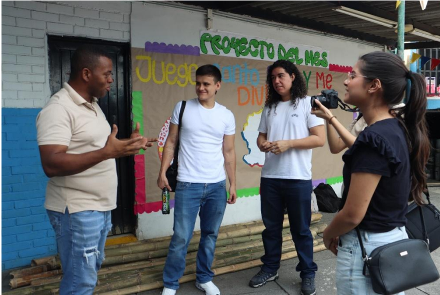
Figura 7. Visita a La Casa de memoria en Charco Azul, 2024.