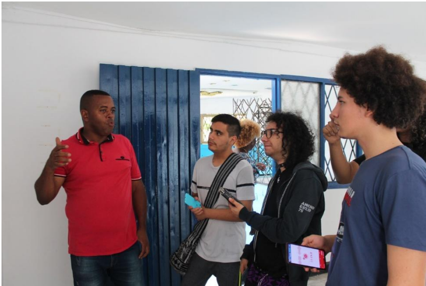
Figura 8: Visita a La Casa de memoria en Charco Azul por estudiantes de la asignatura Comunicación, Cultura y Sociedad en el semestre 2024-1.