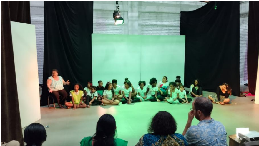
Figura 5. Fotografía tomada del Musical Dónde meter la cabeza 2024.