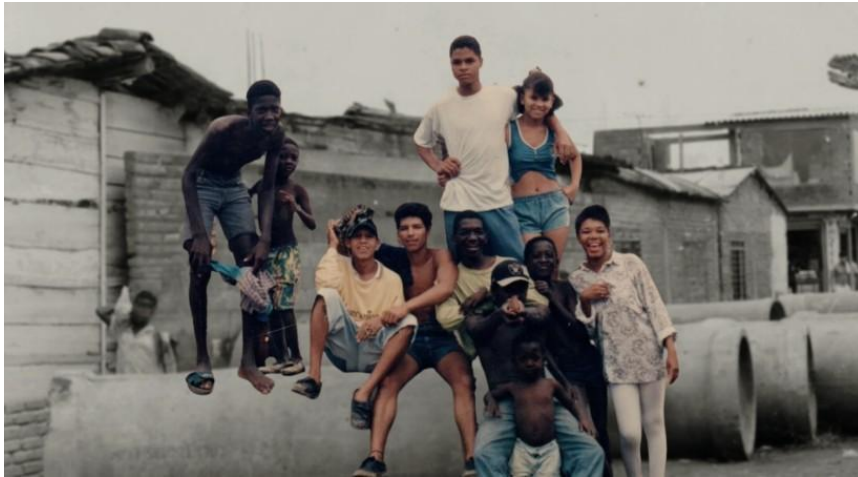
Figura 9: Fragmento fotorelato