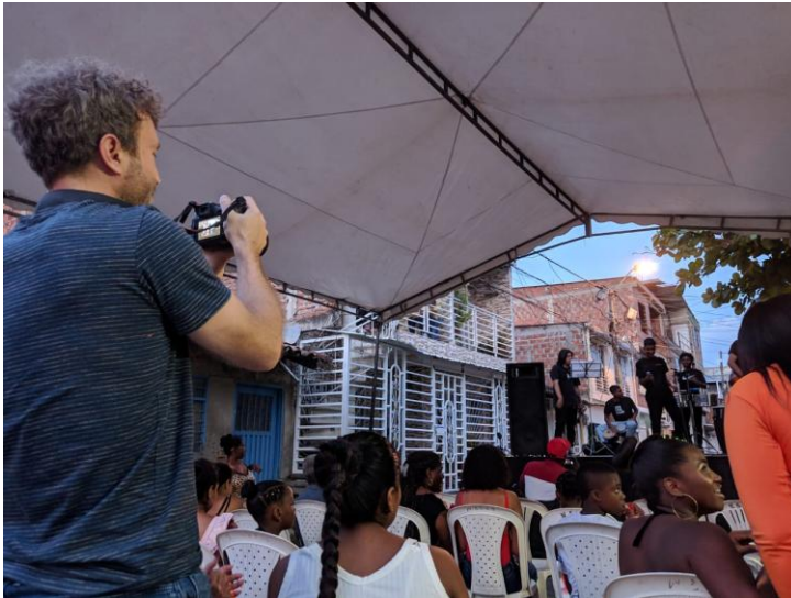
Figura 6. Fotografía tomada en el evento de Halloween de Son de mi gente 2023.

Esta fase se realizó gracias a distintos encuentros, para iniciar con la investigación fenomenológica compuesta por historias, anécdotas y percepciones del mundo para descubrir cuáles, desde su perspectiva, son las maneras de construir paz.