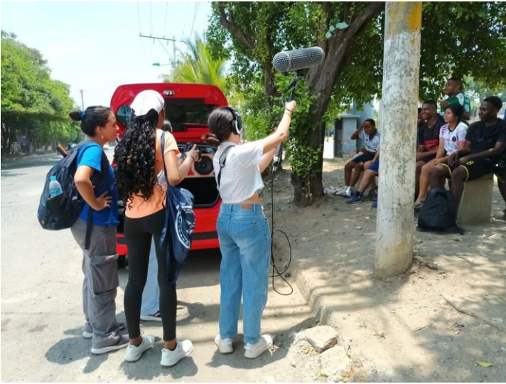
Figura 11: Visita a Charco Azul estudiantes Laboratorio de narrativas transmedia.