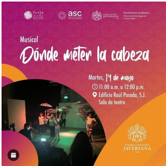
Figura 4. Pieza de divulgación del Musical Dónde meter la cabeza 2024.