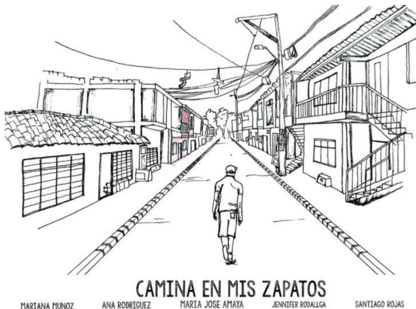
Figura 10: Portada del producto Camina en mis zapatos