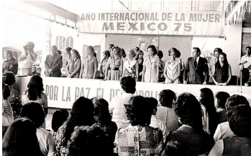
Imagen de la conferencia mundial sobre la mujer en México 1975.