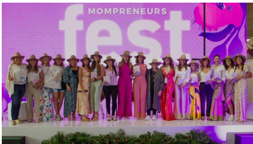
Imagen de la celebración Mompreneurs Fest. La Fiesta de emprendimiento más grande de Latinoamérica realizada en Abril 2024 en Colombia.